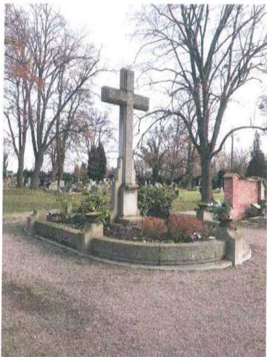
1. Celkový pohled