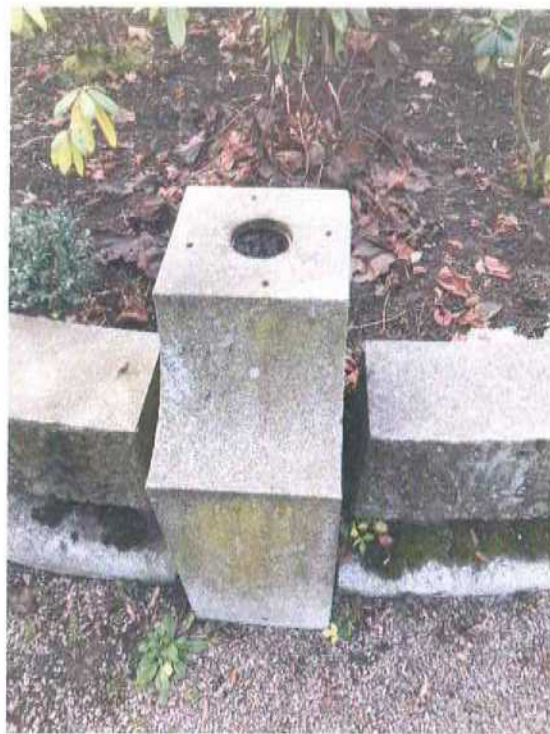
2. Detail vzájemného vychýlení bloků obruby