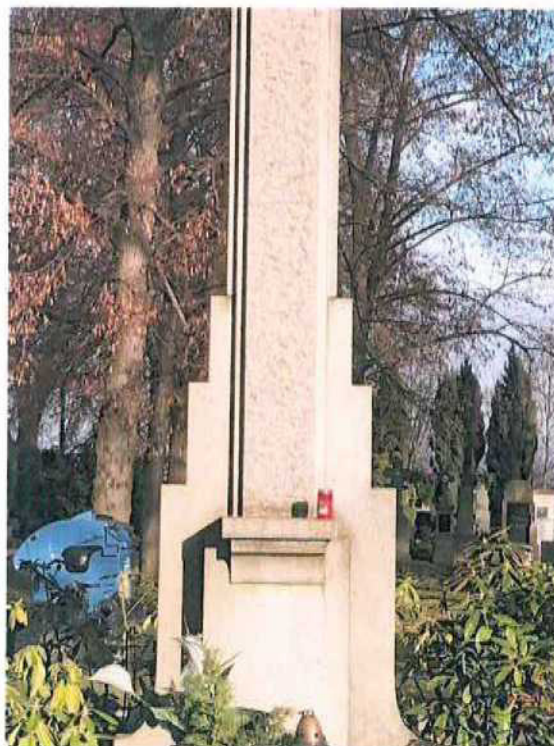
4. Pohled na spodní část kříže