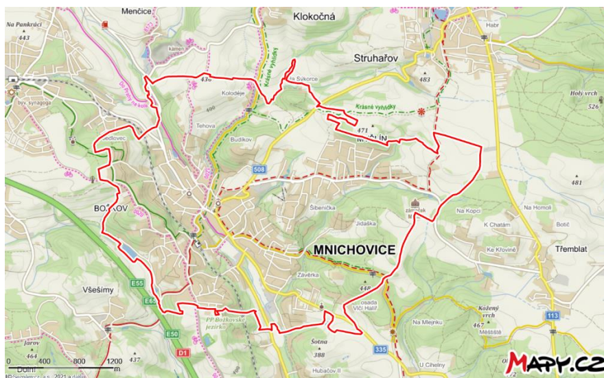
Mapa města Mnichovice, zdroj: Mapy.cz, 2021.

Město Mnichovice a jeho 3 950 obyvatel obsluhují 3 autobusové (489, 490 a 495) a 2 železniční linky (S9 a R49). Město má 3 místní části: Božkov (cca 700 obyvatel), Mnichovice (cca 3000 obyvatel) a Myšlín (cca 250 obyvatel). Váha významnosti linek je nejprve rozdělena podle počtu obyvatel v místních částech: Božkov 0,18; Mnichovice 0,76 a Myšlín 0,06.