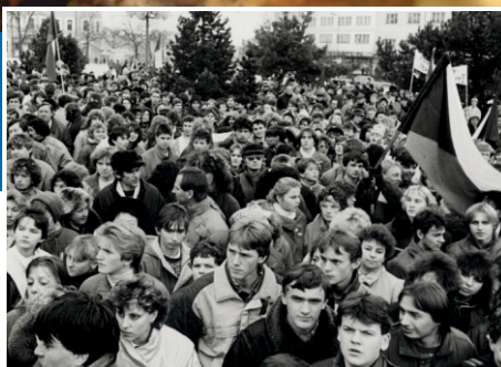
Čáslav oslaví 30. výročí listopadové revoluce