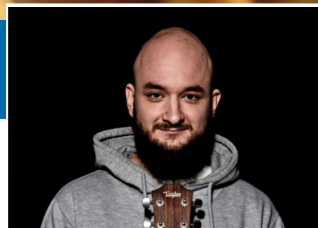
Hostem Grand Festu bude také zpěvák „Pokáč“