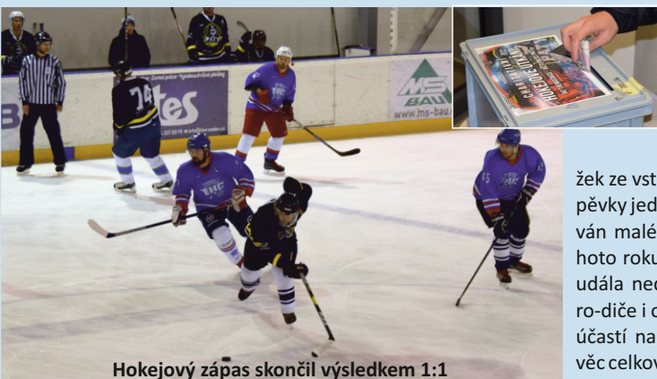
Hokejový zápas skončil výsledkem 1:1

Ve středu 16. října se na čáslavském zimním stadionu uskutečnil charitativní hokejový zápas mezi HC Třemošnice a místním HC Fitness Paty. Celý výtěžek ze vstupného spolu s dalšími příspěvky jednotlivců a firem, bude věnován malé Gábince, která v srpnu tohoto roku při tragické nehodě, jež se udála nedaleko Čáslavi, přišla o oba ro-diče i o sourozence. Čáslaváci svojí účastí na zápasu přispěli na dobrou věc celkovou sumou 63 111 Kč. zn